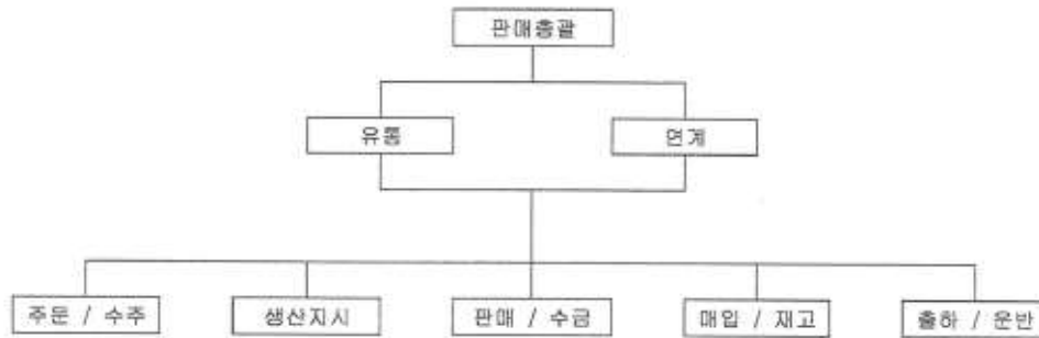
- 판매조직도 -